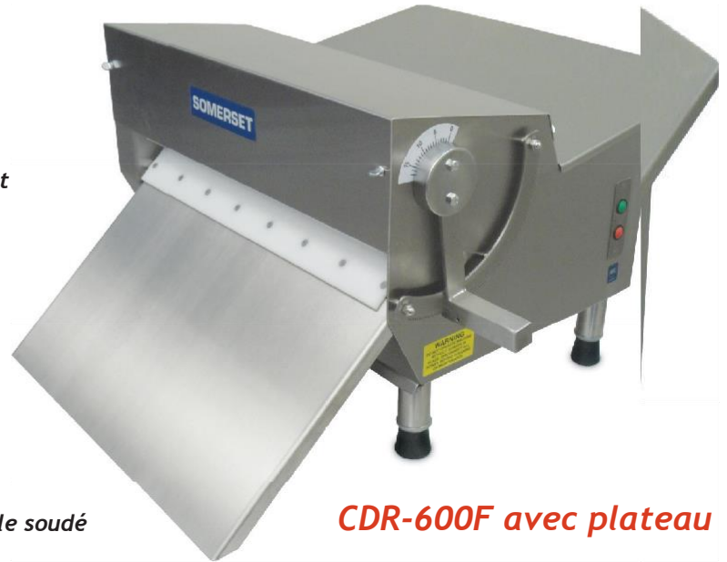
CDR-600F avec plateau